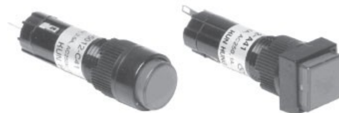
KH-5012-C41 원 형