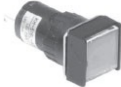
KH-516-A00 KH-516L-A00 정사각형