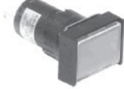
KH-516-B00 KH-516L-B00 직사각형