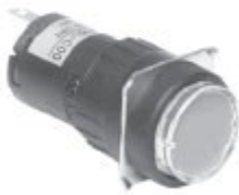
KH-516-C00 KH-516L-C00 원 형