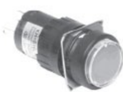
KH-516-C11,12 KH-516L-C11,12 원 형