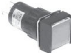
KH-516-A11,12 KH-516L-A11,12 정사각형