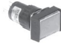
KH-516-B11,12 KH-516L-B11,12 직사각형