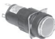
KH-516-C21,22 KH-516L-C21,22 원 형