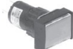
KH-516-B21,22 KH-516L-B21,22 직사각형