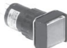
KH-516-A21,22 KH-516L-A21,22 정사각형